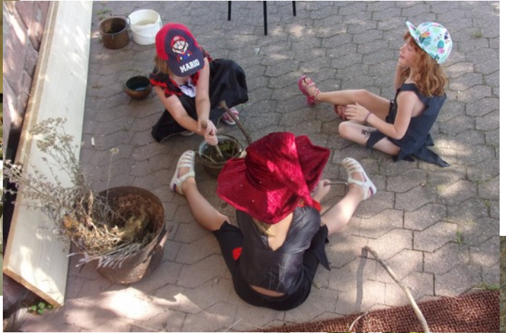
Journée petits sorciers, 2019

Vous avez envie d'un jeu sur mesure ? Une ambiance particulière ?