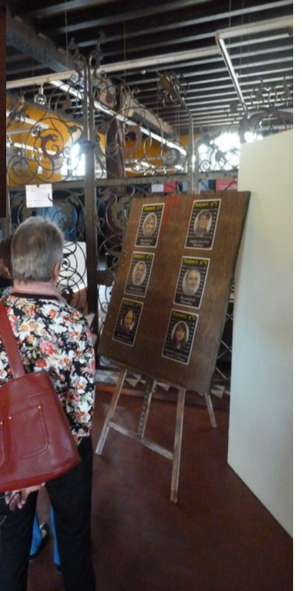
Nuit des musées, Haguenau 2016