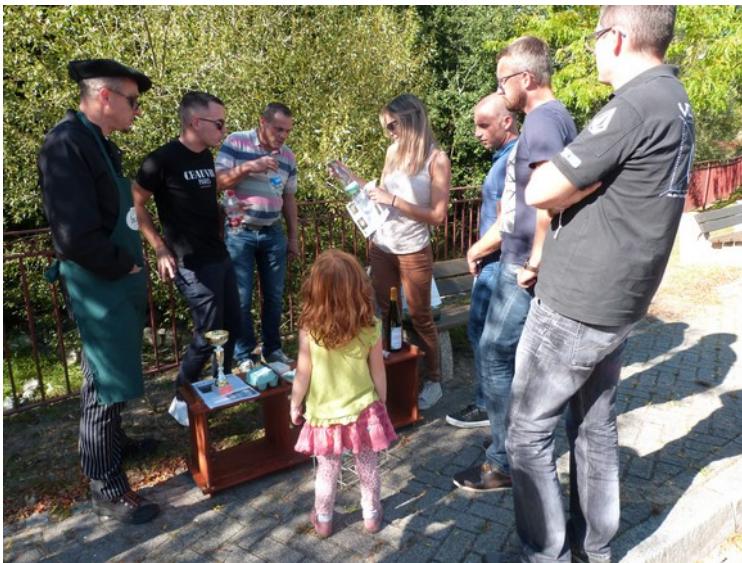
Vallée de Munster 2019