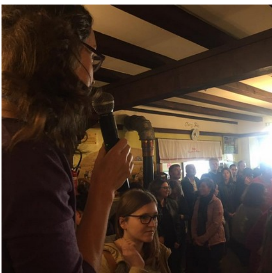
Séminaire CAE Alsace, 2017