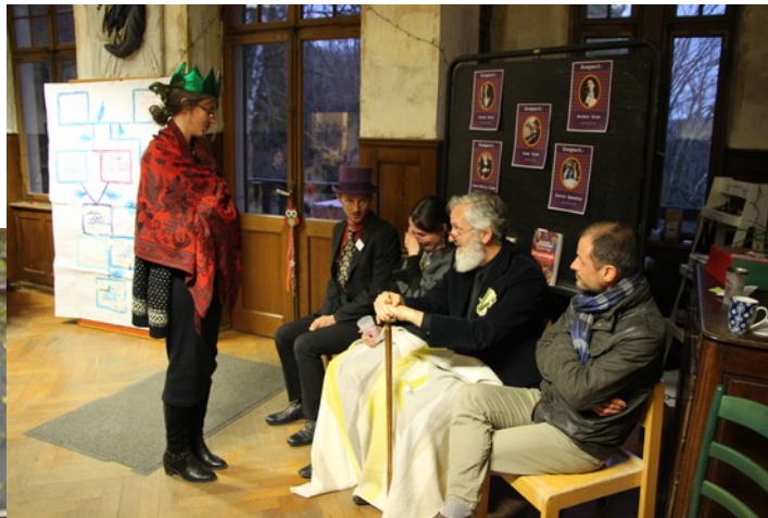
Domaine de la chouette 2022, cluedo guérisseur