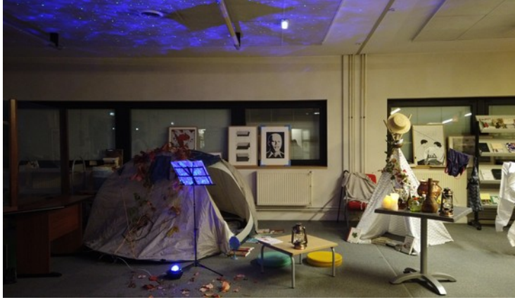
Soirée Zombie Héricourt, 2021