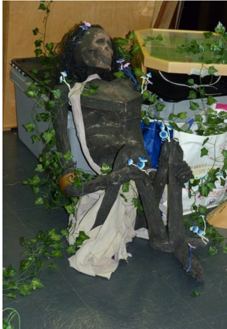
Médiathèque Héricourt 2019